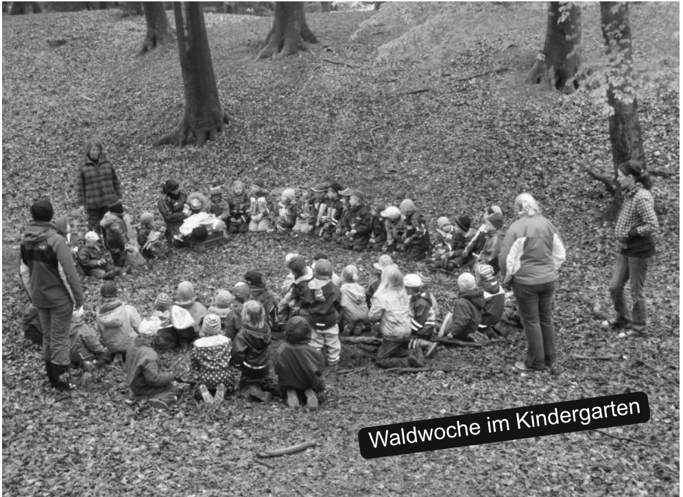
Waldwoche im Kindergarten