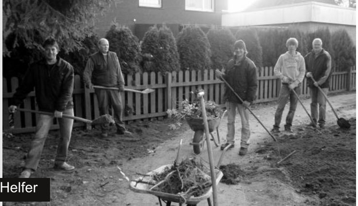
Viele fleißige Helfer

Vielen Dank für die vielen helfenden Hände!