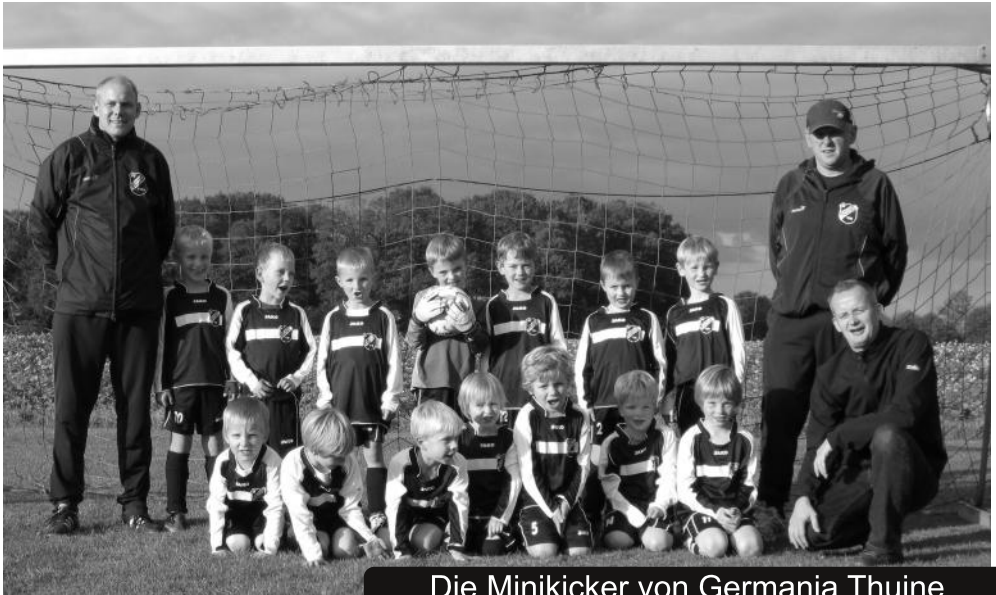
Die Minikicker von Germania Thuine

Hinweis: Die F-Jugend startet wieder am 10.01. und die Minikicker am 12.01. (jeweils um 17 Uhr) mit dem Training in der Turnhalle.