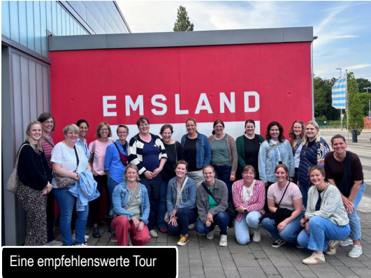
Eine empfehlenswerte Tour

Nach so vielen Eindrücken ging es weiter in die L'Osteria. Dort wurde gegessen, erzählt und viel gelacht. Am Ende blieb vor allem das Gefühl: Solche gemeinsamen Abende tun einfach gut und