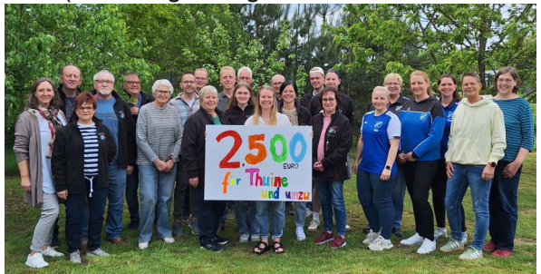
Theatergruppe mit den freudigen Spendenempfängern/innen aus Thuine

Mit der Spendenaktion bedankt sich die Theatergruppe bei ihrem Publikum und allen Unterstützerinnen und Unterstützern, die die Saison möglich gemacht haben.