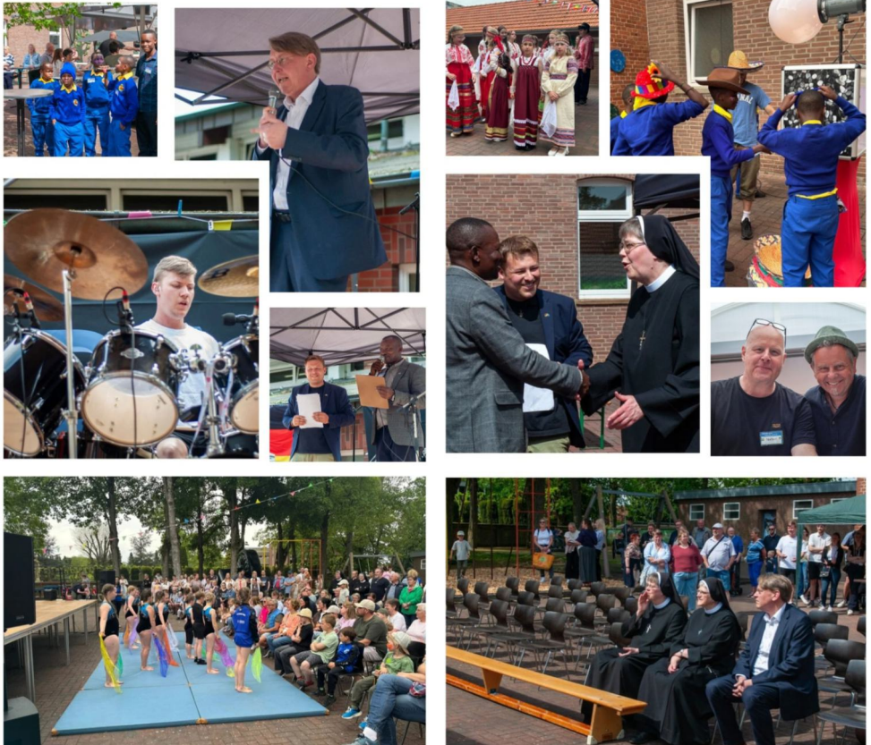
Ein gelungenes Fest mit vielen tollen Auftritten, Attraktionen sowie neuen und alten Freunden

Ein rundum gelungener Nachmittag, der noch lange in Erinnerung bleiben wird.