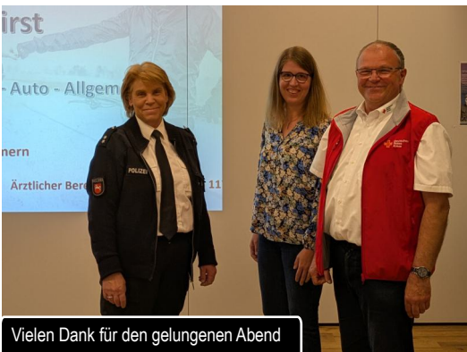
Vielen Dank für den gelungenen Abend