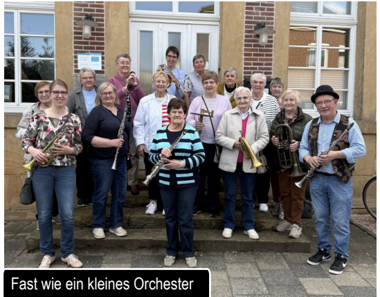
Fast wie ein kleines Orchester

Die Kfd ist sich sicher: „Ein Besuch lohnt sich“!