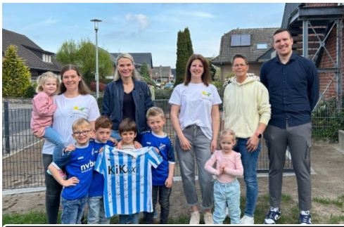
Der Besuch aus Meppen brachte ein tolles Geschenk

von der Geschäftsstelle des SV Meppen kam persönlich in die Kita, um das Engagement zu würdigen. Als Dankeschön brachte er ein originales Trikot aus dem DFB-Pokalspiel des SV Meppen mit, das sowohl der Kita als auch dem Förderverein überreicht wurde. Vielleicht, so die Idee, kann dieses besondere Stück sogar zur weiteren