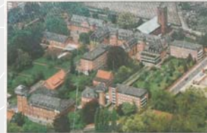
Den Tourismus in Thuine beleben will der HHG. Dafür bietet sich unter anderem das Kloster an.

Aktiv an der Dorfneuerung können sich alle Bürger aus Thuine mit der Fragebogenaktion des Arbeitskreises zur Dorfneuerung beteiligen und die verteilten Zettel bis zum 10. September in die aufgestellten Sammelboxen bei der Volksbank oder im Gemeindebüro einwerfen.